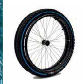
DOPPIA RUOTA MTB