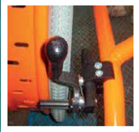
FRENO DI STAZIONAMENTO